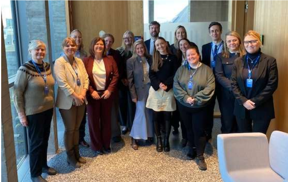
Mynd tekin 17. febrúar af íslenskum þingmönnum, dönsku sendinefndinni og fulltrúum stjórnar KynHeil.